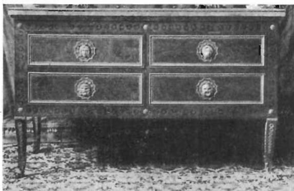
FIG. 8 - Uno dei due «forzieri» già nella «Stanza di Elena e Paride».

mo (v. fig. 4), finite da capitelli in bronzo dorato: nella fronte corre un festone, pure in bronzo dorato, sostenuto da bucrani. Per quanto non se ne abbiano notizie, crediamo che il camino possa attribuirsi al Pacetti, che aveva già eseguito per la sala i quattro