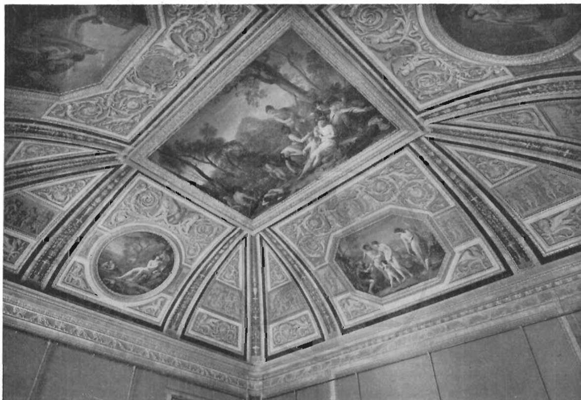
FIG. 10 - ROMA, GALLERIA BORGHESE - Volta della « Stanza di Elena e Paride » (particolare).

probabilmente, alla guerra di Troia, in giallo dorato; i quali, benché interrotti da cornici, sono in realtà concepiti come un fregio che legghi insieme, con il susseguirsi del suo movimento, le tele con le figurazioni principali poste nei rinfianchi. Sia il fregio che gli ornati si devono ritenere opera di quel Giovan Battista Marchetti al quale appartiene tutta la parte più propriamente ornamentale della decorazione della Palazzina, e che qui, come altrove, sa rivelarsi fine esecutore 10 . I riquadri della volta, racchiusi entro cor-