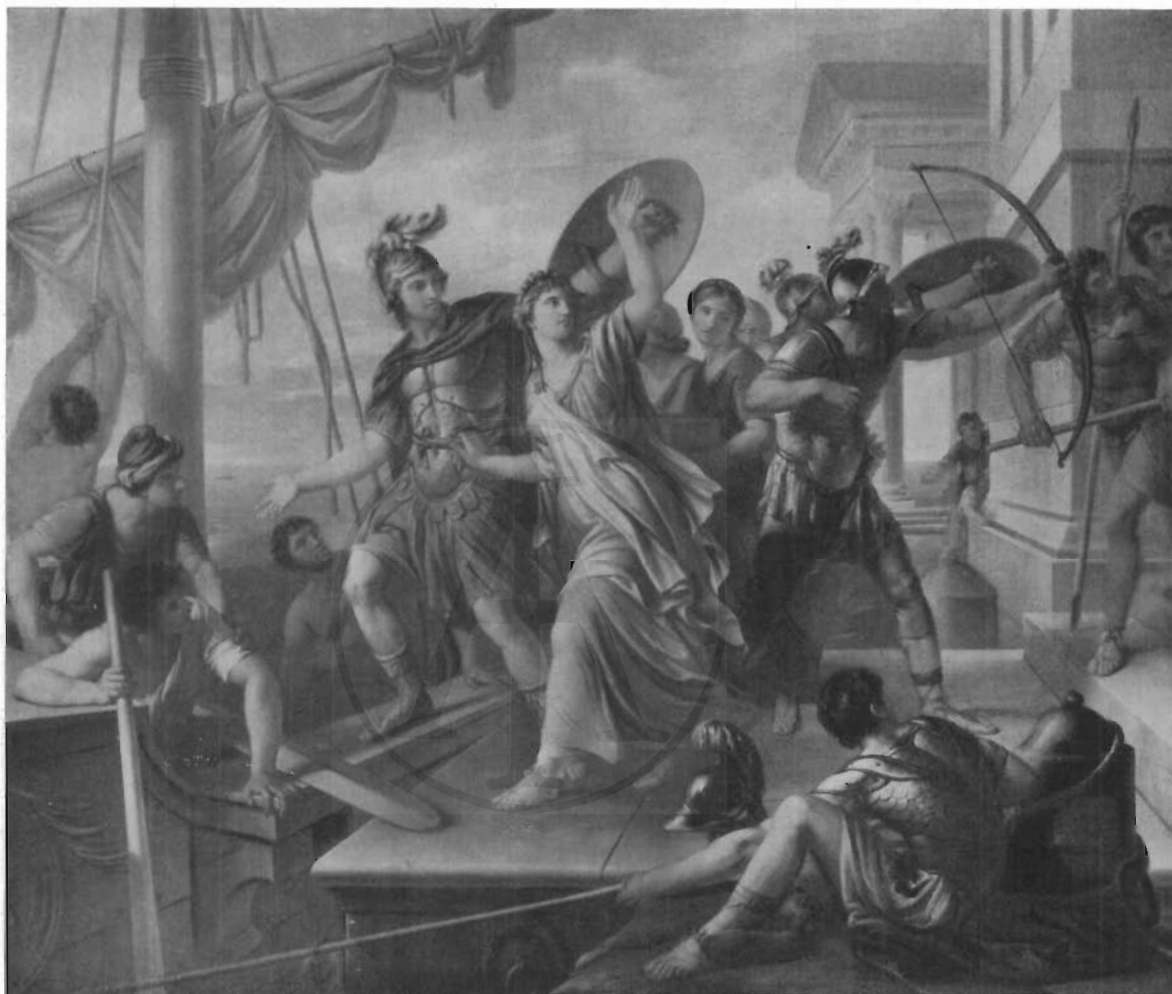
FIG. 2 - G. HAMILTON: Il ratto di Elena.

cinque de' quali sono già dipinti. . . il nostro pittore stende le sue immagini sulle tracce di Omero, di Stesicoro e di Ovidio » 3) . Non era la prima volta che il pittore inglese era attratto dal tema dell'Iliade: celeberrimi un « Achille che trascina il corpo di Ettore intorno alle mura di Troia » dipinto una ventina di anni prima, oltre ai « Funerali di