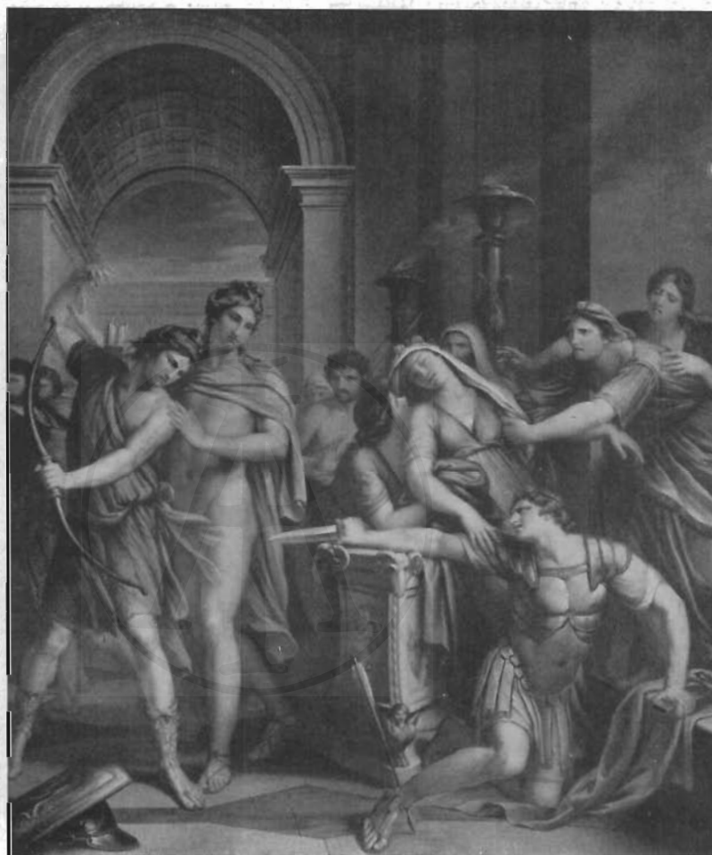
FIG. 3 - G. HAMILTON: La morte di Achille.

figurazione. Appunto così sono concepiti – in modo del resto comune alla tarda antichità – i rilievi della Tabula Iliaca. Le scene salienti della « Storia di Paride » sono espresse in otto riquadri su tela. Eccone i soggetti: sulla volta: 1) « Paride bambino consegnato ai pastori del monte Ida » (più tardi sostituito da una tela del Camuccini), 2) « Paride educato da Amore », 3) « Il giudizio di Paride », 4) « Paride abbandona Enone », 5) « La morte di Paride », al centro della volta. Sulle pareti erano le tre tele ora ritrovate e cioè: 6) « Venere offre Elena a Paride », 7) « Il ratto di Elena », 8) « La morte di Achille ». Le cinque tele della volta, tuttora in situ, risultano dai documenti