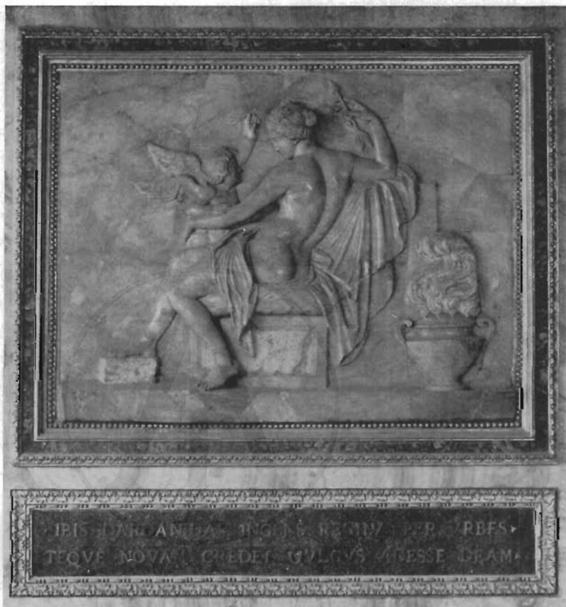
FIG. 7 - ROMA, GALLERIA BORGHESE, STANZA DI ELENA E PARIDE - V. PACETTI: Soprapporta con il rilievo della « Venere ».

venne posto il grande vaso di porfido verde poggiante su alta base di porfido verde a specchi rossi, su breve zoccolo di marmo nero, eseguito da Guglielmo Grandjacquet, ricordato assai ammirativamente da tutte le fonti ed ancora in Galleria. Così pure sono giunti fino a noi i vasi di alabastro collocati simmetricamente ai quattro angoli della sala, su basi costituite da un rochio di granito bigio con capitello bianco decorato da festoni e bucrani in bronzo 12) . Alle due pareti brevi si addossavano due « forzieri di finissimi legni, ornati con metalli dorati di gran lavoro e forniti ad di sopra di due bellissime tavole di giallo antico brecciato » 13) (fig. 8), mentre nella parete principale si apre un bel camino di giallo antico con affiancate colonnine dello stesso mar-