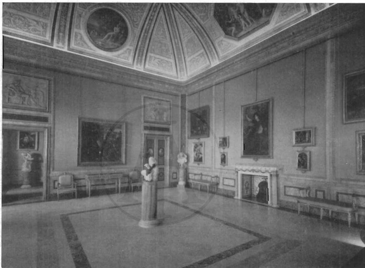
FIG. 4 - ROMA, GALLERIA BORGHESI - Stanza di Elena e Paride.

lavoro - 5 marzo 1785 - Gavino Hamilton ne riceve il saldo. Le otto tele con le « Storie di Paride » vengono ad essere, è naturale, la parte più importante ed impegnata del complesso decorativo della sala borghesiana. Se non è qui luogo di rilevare il loro peso nella storia della cultura contemporanea quale espressione fra le più sorvegliate ed erudite di una poetica che proprio in quegli anni si andava chiarendo, non possiamo non notare la loro altissima qualità decorativa. Per essa sia gli scomparti della volta - tondi