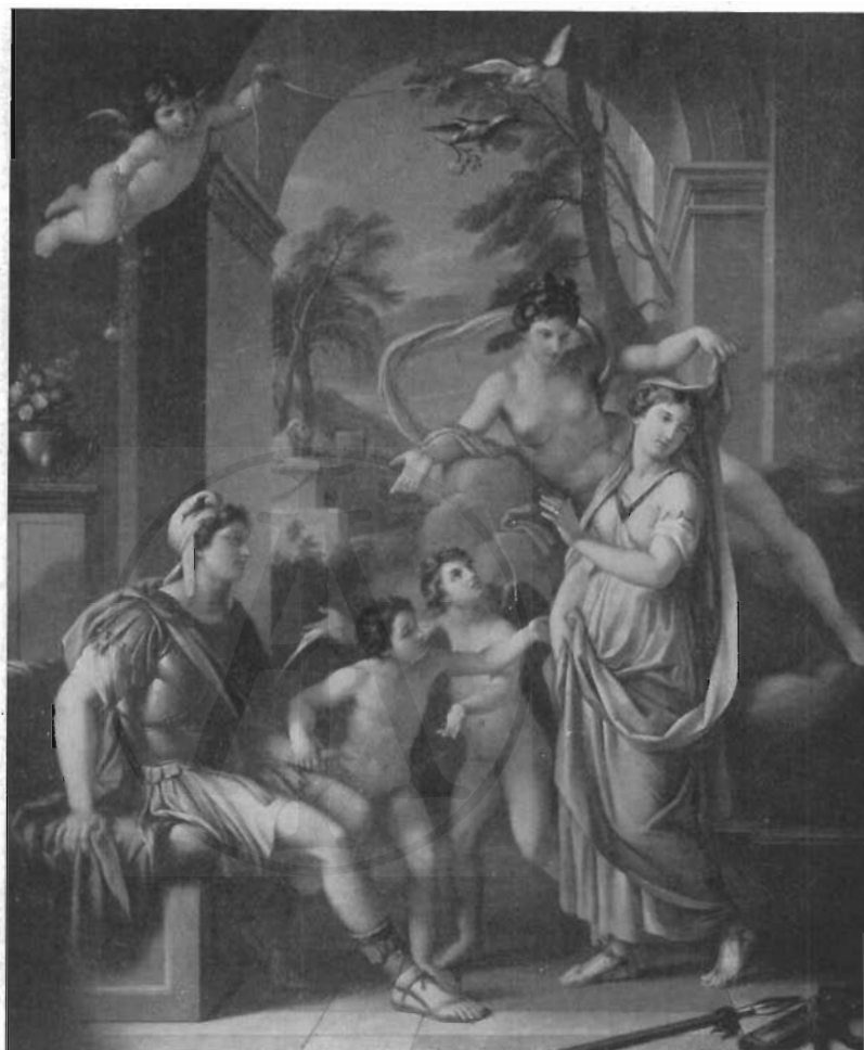
FIG. 1 – G. HAMILTON: Venere offre Elena a Paride.

Storie di Paride, e l'ha divisa in otto quadri